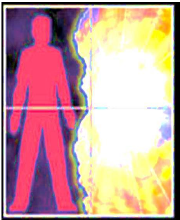
‘Hombre en Pecado’ Separado de Dios’

Al pecar, la persona rompe su amistad con Dios y se expone a las acechanzas del enemigo.